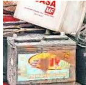
Baterías plomo ácido