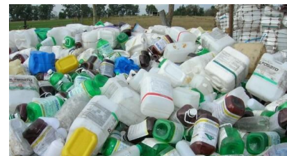
Envases de Plaguicidas domésticos