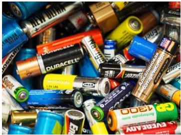
Pilas y baterías

Residuos que contienen materiales tóxicos o que al entrar en contacto con otros generan líquidos contaminantes, como: