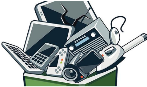
Computadoras e impresoras en desuso